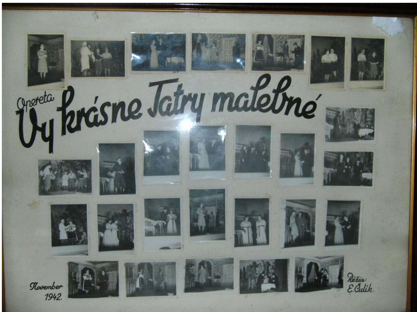
ŠKOLSKÉ DIVADLO NOVÁ BAŇA-MESTO