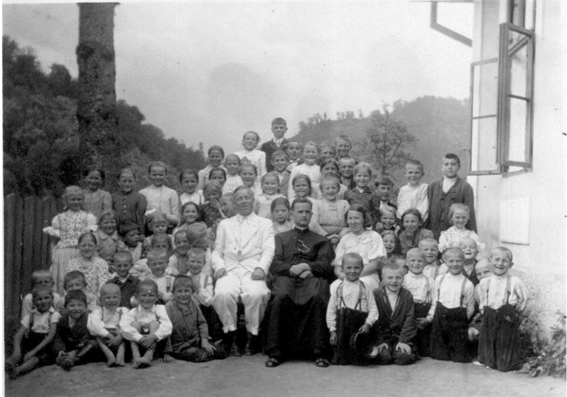
Štátna ľudová škola v Starej Hute v školskom roku 1938-39